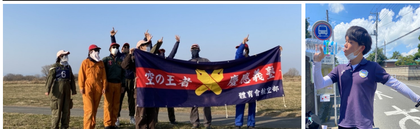
↑最終クールで周回した緑川選手を迎えるクルー